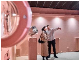
写真6： カシミヤ・スパの一部：新世代ランドリーケアの最上位モデル「W2 Nova Edition」は、世界初のリブなしドラム「InfinityCareハニカムドラム」を採用し、ランドリーケアと衣類の寿命のさらなる向上を実現しました。（写真提供：Miele）※日本での発売は未定

写真5： カシミヤ・スパの一部：新世代ランドリーケアの最上位モデル「W2 Nova Edition」は、世界初のリブなしドラム「InfinityCareハニカムドラム」を採用し、ランドリーケアと衣類の寿命のさらなる向上を実現しました。（写真提供：Miele）※日本での発売は未定