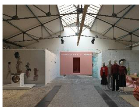
写真4： 世界初の“カシミア・スパ”は、優れた品質と耐久性を誇る2つのブランドのユニークなコラボレーションです。（写真提供：Miele）

写真3： “カシミア・スパ”の来場者は、ライブデモとインタラクティブな要素を通じて、カシミアケアの高い芸術性を体験することができます。（写真提供：Miele）