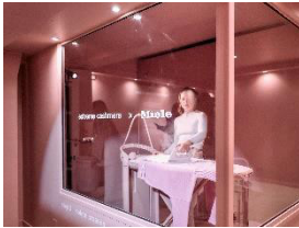
写真7： 洗濯はMieleの洗濯機で行います。定評のあるハニカムドラムは、ドラムと生地の上に水の層を形成し、カシミヤをやさしく滑らせながら洗うことができます。洗濯が終わったら、スパで平らに広げて乾燥させた後、Miele FashionMaster（日本での発売は未定）でやさしくスチームケアします。（写真提供：Miele）

写真6： カシミヤ・スパの一部：新世代ランドリーケアの最上位モデル「W2 Nova Edition」は、世界初のリブなしドラム「InfinityCareハニカムドラム」を採用し、ランドリーケアと衣類の寿命のさらなる向上を実現しました。（写真提供：Miele）※日本での発売は未定