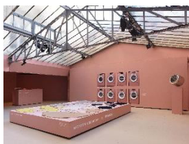
写真1： パリ・ファッションウィークにおいて、Mieleとextreme cashmereは世界初の“カシミア・スパ”を開催します。このインスタレーションの大きなハイライトは、カシミア・スパのためだけに芸術的に演出された「ティーローズ」カラーの8台の洗濯機です