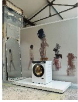
写真5： カシミヤ・スパの一部：新世代ランドリーケアの最上位モデル「W2 Nova Edition」は、世界初のリブなしドラム「InfinityCareハニカムドラム」を採用し、ランドリーケアと衣類の寿命のさらなる向上を実現しました。※日本での発売は未定