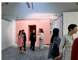
写真2： 2025年3月5日から8日まで、パリのシュヴェール通り36番地は特別な隠れ家と化します。刺激的なパリ・ファッションウィークの期間中、プレミアム家電メーカーMieleとextreme cashmereは協力して、高品質のカシミアのためのスパを開催します。（写真提供：Miele）

写真1： パリ・ファッションウィークにおいて、Mieleとextreme cashmereは世界初の“カシミア・スパ”を開催します。このインスタレーションの大きなハイライトは、カシミア・スパのためだけに芸術的に演出された「ティーローズ」カラーの8台の洗濯機です（写真提供：Miele）