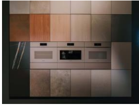
写真2 ：温かみのある新しいカラー「パールベージュ」の Designline ArtLine は、ダークウッドと組み合わせることで、魅力的ながら温かみのある印象を与えることができます。パールベージュは、ホワイトまたはパステルカラーと合わせることで、上品で軽やかな雰囲気を生み出します。