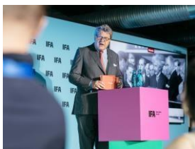
写真 1：Miele が IFA に出展するイノベーションのプレビューを初披露する Miele Group 業務執行取締役兼共同経営者の Dr.ラインハルト・ツインカン